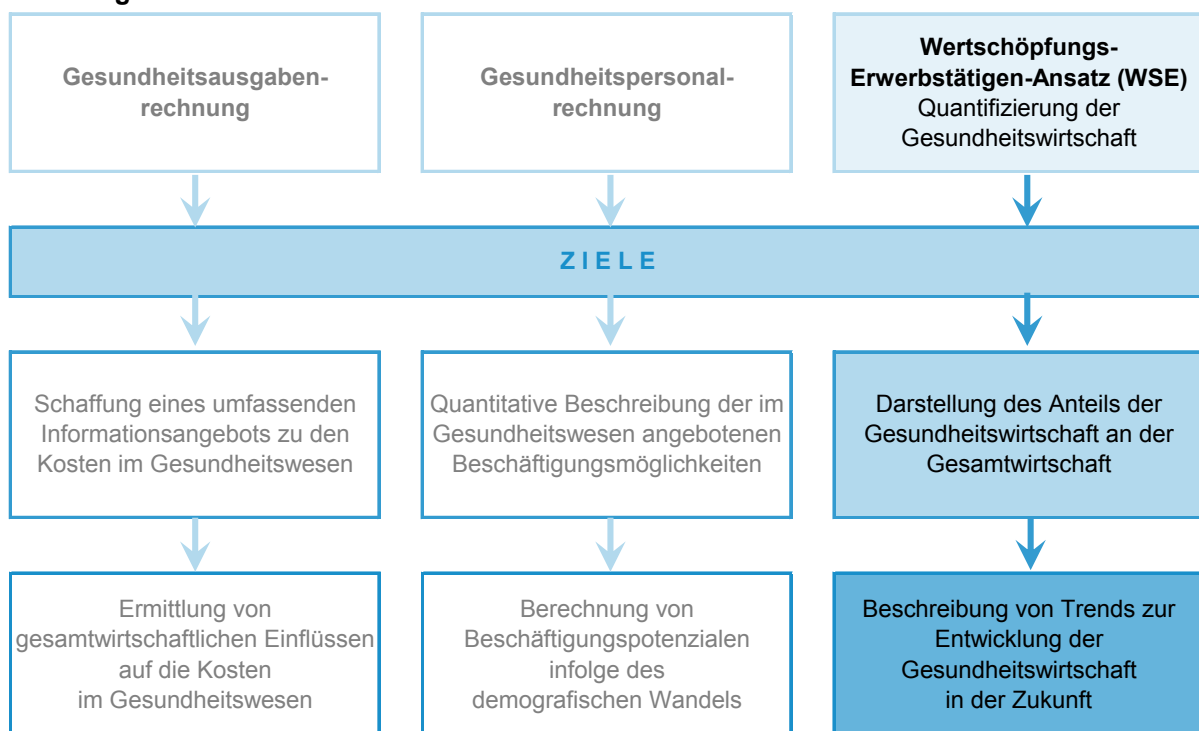
Abbildung 1: Handlungsstrategien zur Entwicklung der Gesundheitsökonomischen Gesamtrechnung

Zur Quantifizierung der Gesundheitswirtschaft stehen im Rahmen der amtlichen Statistik verschiedene Datenquellen zur Verfügung. Ziel ist es, die Bruttowertschöpfung und die Zahl der Erwerbstätigen in der Gesundheitswirtschaft auf Länderebene zu bestimmen, wobei die Passfähigkeit der Daten zu den amt-